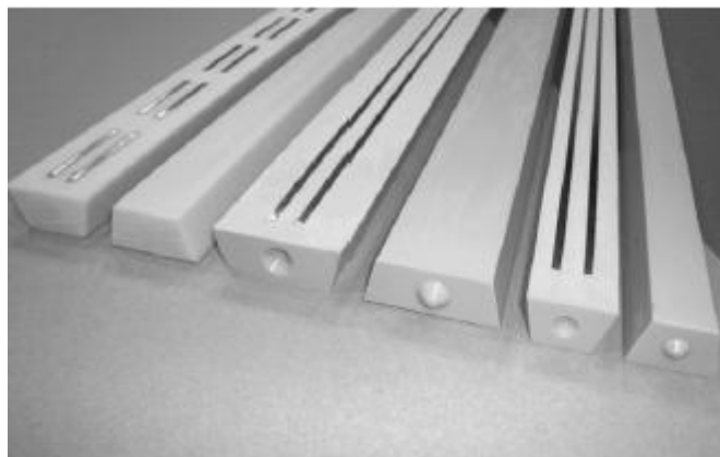
Figure 1 : Vue 3D